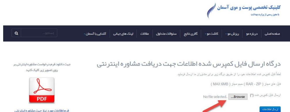
( تصویر ۵ )

۷- در صفحه ارسال فایل بر روی دکمه brows که در تصویر ۵ نمایان است کلیک نمایید.