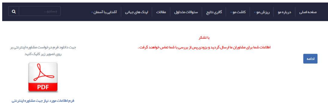
( تصویر ۷ )

۹- در صورتیکه فایل تهیه شده شما دارای مشخصات فوق باشد، سیستم به شما پیغام موفقیت آمیز بودن ارسال اطلاعات را که در تصویر ۷ مشاهده مینمایید که را به شما نمایش می دهد .