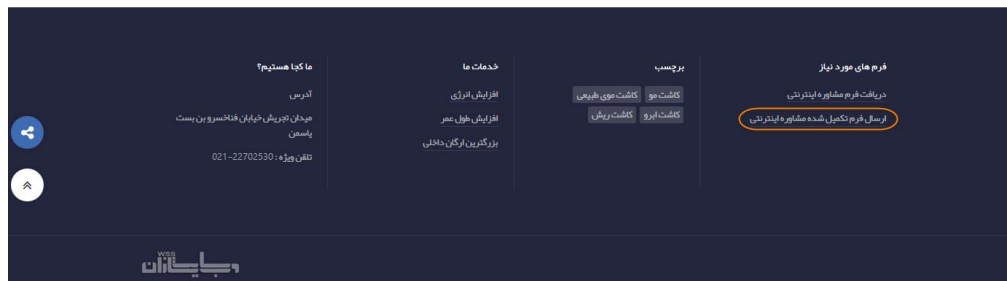
( تصویر ۴ )

۷- در صفحه ارسال فایل بر روی دکمه brows که در تصویر ۵ نمایان است کلیک نمایید.